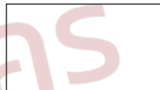
ดิตรูปตราสัญลักษณ์สินค้า/บริการ